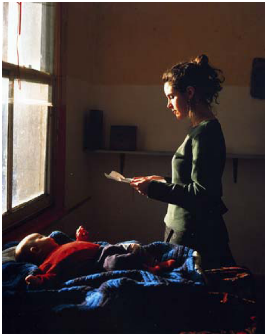
Woman Reading Possession Order, 1997 épreuve cibachrome © Tom Hunter

l'autre forcent par leur usage les conventions. L'artiste brouille les genres et provoque des ravages imprévus par cette reprise de la peinture classique continuellement détournée. Spécialiste d'une théâtralisation exacerbée Hunter mélange tout dans ses corps et