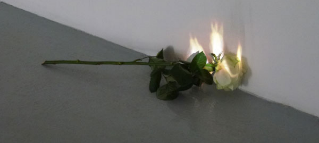
Sans tire (The Rose) , Installation vidéo, projecteur vidéo, HD, lecteur DVD, rose © Laurent Pernot

perspective que la vidéo de Nelly Girardeau, création issue de sa résidence à VIDEOFORMES, est traversée par une réflexion sur la dimension picturale, photographique et sculpturale de l'image. Entre statisme et mouvement, cette vidéo de Nelly Girardeau fait référence à la statuaire bestiaire ou mortifère. Interrogeant la fabrication des images, elle perturbe nos mécanismes de perception.