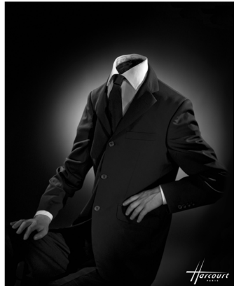
Portrait 1, noir & blanc, tirage Lambda, 60x80 cm

2 - Depuis juin 2010 ces journées artistiques sont organisées une fois sur deux ailleurs qu'à Fiac, mais elles restent cantonnées au «Pays de Cocagne», ce pays plus ou moins mythique illustré jadis par Bruegel dans un tableau célèbre portant ce titre (1567, Alte Pinacothek de Munich).