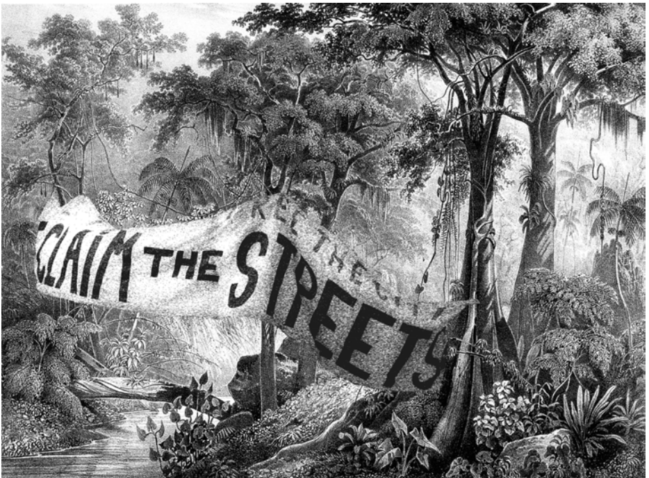
El Dorado, Vidéo HD en boucle, 2012 ©Brigitte Ziegler, courtesy Galerie Odile Quizeman