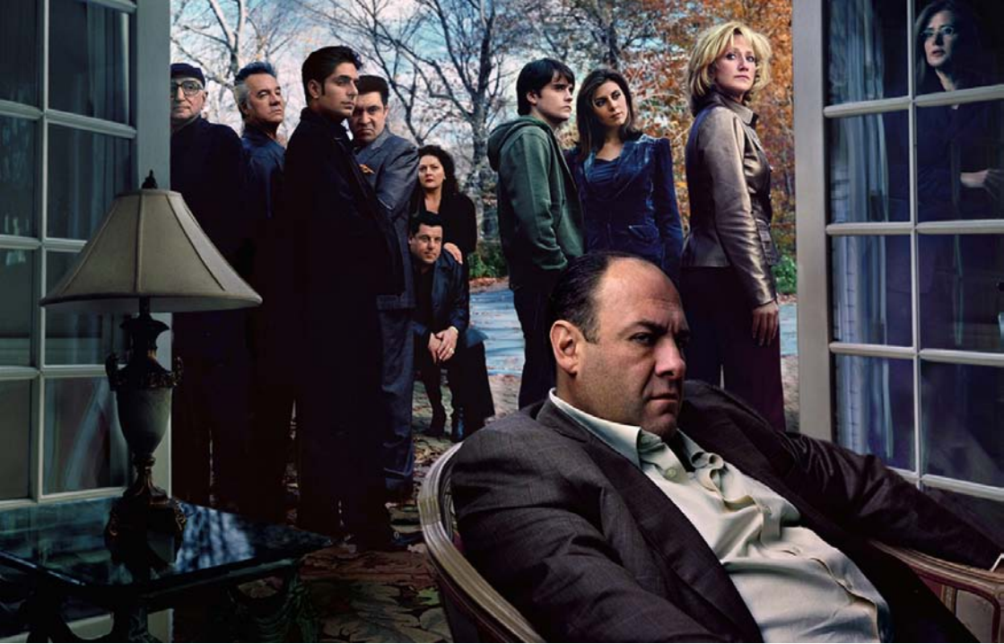
Les Sopranos ©

Avènement du second degré, triomphe de la post-télévision après celui du post-cinéma. Les Sopranos , finalement, sont plus proches de Pulp fiction que des Incorruptibles (la série avec Robert Stack). Sans tous ces codes, ces références, ces clins d'oeil, ces allusions, ces renvois, Les Sopranos ne sont rien.