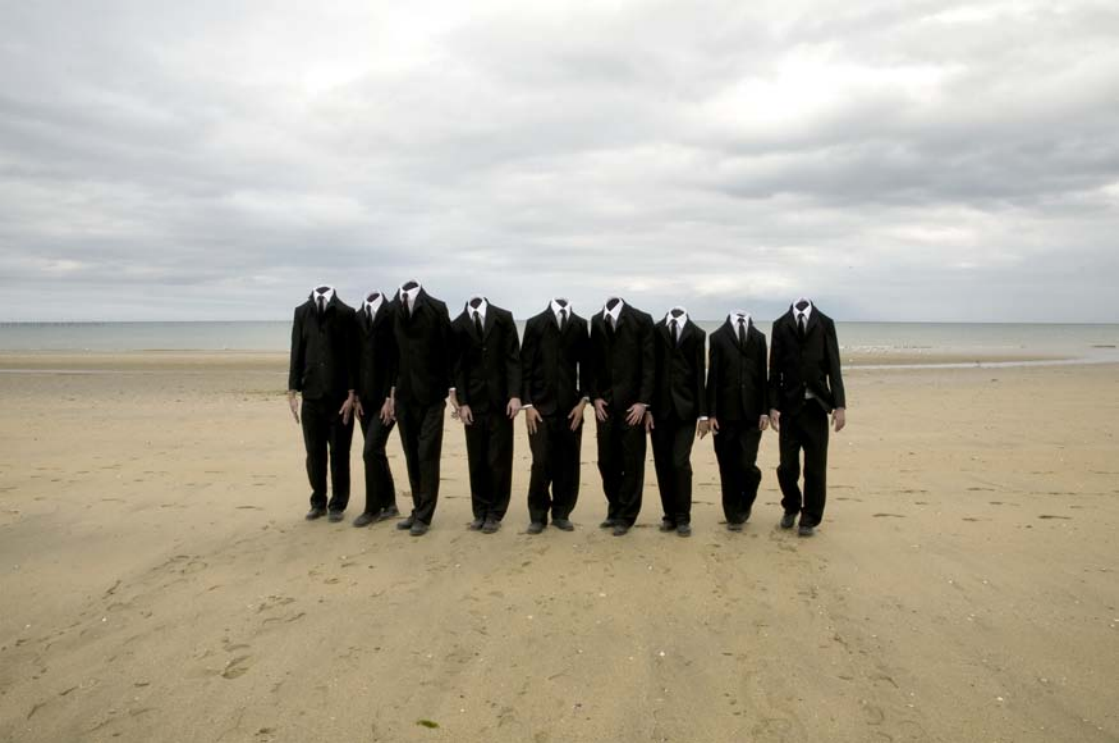
Débarquement 3 , Vidéo HD, 16/9, 20'45" © Marie Aerts, Photo Fanny Adler, 2011, courtesy Galerie Dix9

Marie Aerts est connue pour ses fameux « hommes sans tête », surgis il y a quelques années sur une plage de sable, une plage normande je présume. Ce ne sont pas des échoués, non, puisqu'ils sont debout et avancent d'un bon pas, ni des hommes-grenouilles déguisés en manchots ; ce ne sont pas non plus des soldats habillés en civils et formant un commando qu'un officier de marine demeuré au large dirigerait à distance, malgré ce qu'aurait pu laisser croire le titre, probablement ironique, de la vidéo : Débarquement 3 . Ils semblent venir de nulle part, et aller on ne sait où, probablement au hasard vu l'absence du chef. Leurs vêtements sont impeccables et, en dépit de leur cécité, ces « cols blancs » 3 patibulaires marchent en rangs serrés, avec un bel ensemble, à l'instar