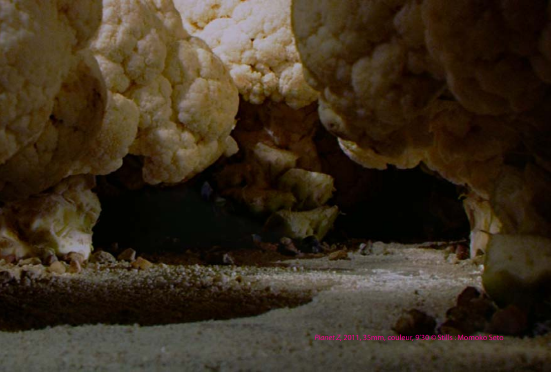
Planet Z, 2011, 35mm, couleur, 9'30