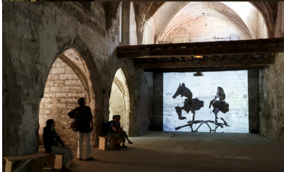
Da Capo , William Kentridge

imposé, on dirige son regard vers l'image qui vous attire le plus. Chacun ses pulsions, ses goûts. Je commence par m'absorber dans la contemplation de décompositions de figures, formées par des lambeaux de sculptures, pivotant sur eux-mêmes. C'est Return . D'abord on ne saurait donner un nom à ce qui est en