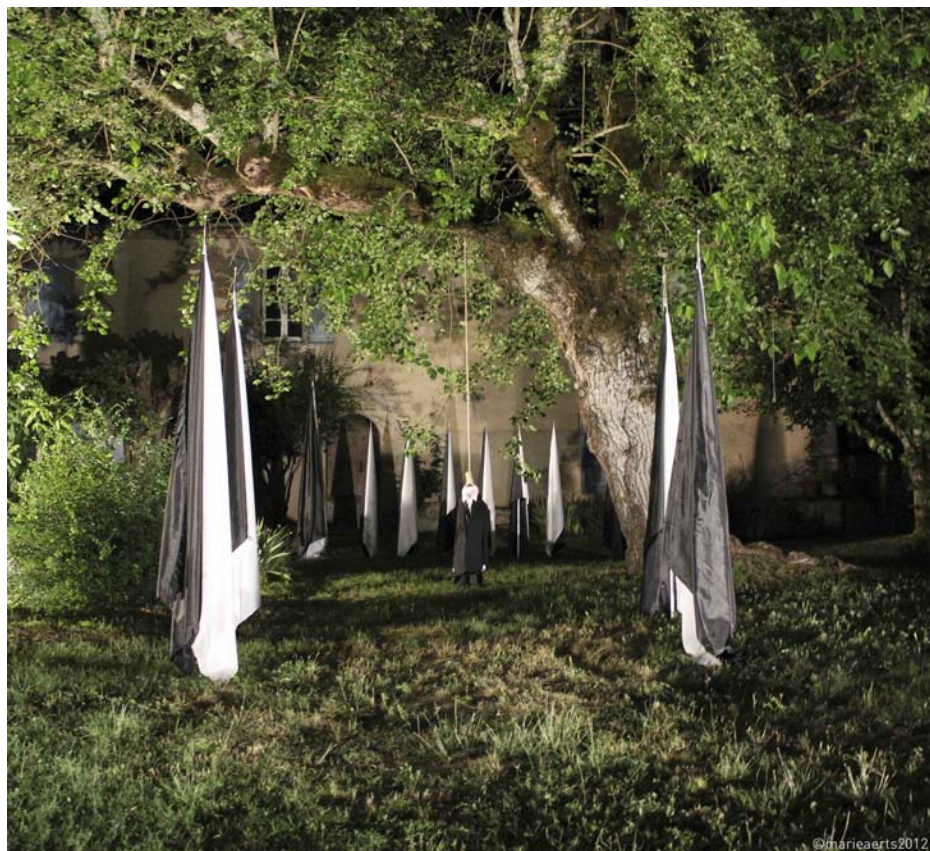
Révolte , installation, technique mixte, « Et plus si affinité » AFIAC juin 2012

aux cimaises du Studio Harcourt 4 , temple parisien du portrait chic, l'un de ces hommes acéphales, les photos avaient été réalisées en collaboration avec l'équipe technique du studio — c'était une remarquable gageure dans cet endroit plutôt mondain où l'on exalte le narcissisme.