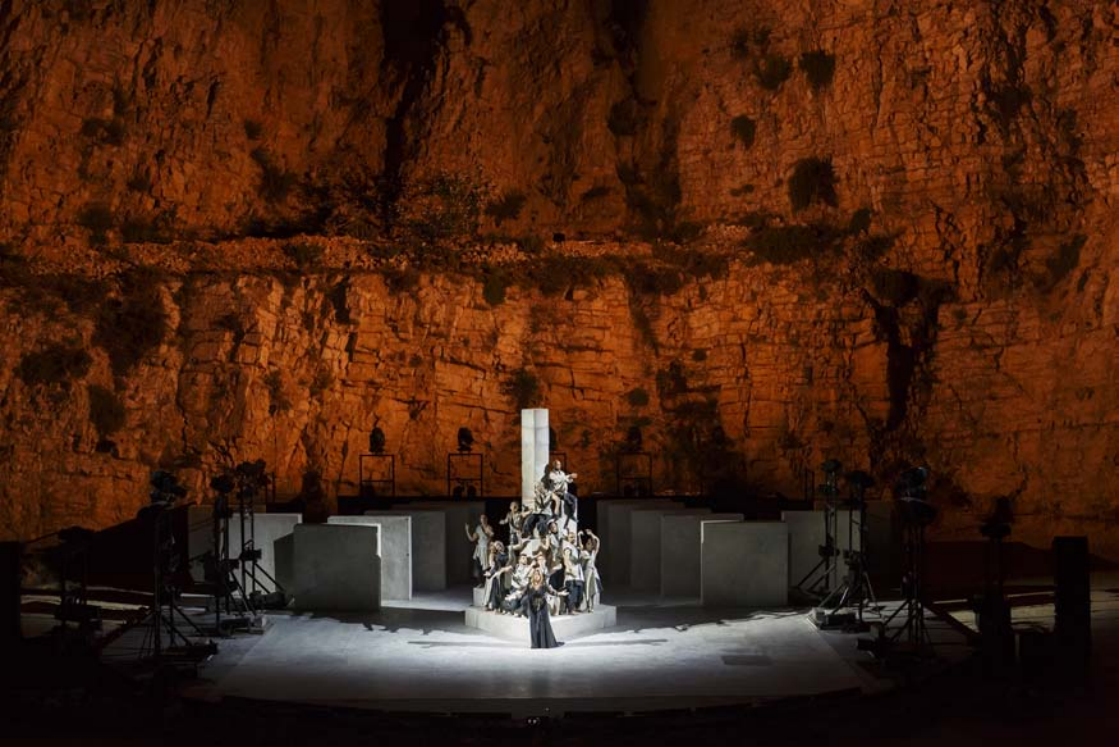
Puzzle, Sidi Larbi Cherkaoui

de Cherkaoui dans le minéral. Les groupes sont cohérents, habités par une présence méditative, enchantée. Ils nous ravissent, nous captivent en haleine, le souffle coupé, l'attention en apnée. C'est à la fois japonais, musulman, totalement métissé, bigarré, pluriculturel et cultuel.