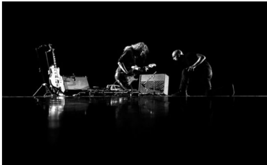
Apache, Hammid Ben Mahi / Yan Pechin

All off my solo féminin succédant à cette pièce fait pâle figure : sur le même sujet, une femme qui danse Hermann Diephuis ne semble pas vraiment inspirée et ennue dans un vain propos chorégraphique soit disant onctueux, ravageur et aguichant. Tout ce qui fait qu'une femme ne danse pas devant nous, mais s'expose, agace et irrite : provocation réfléchie ou embourbement ?