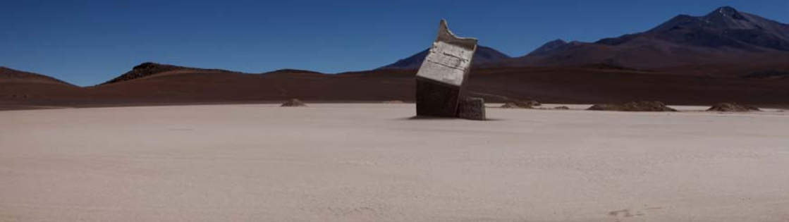
Under The Centipede Sun, Installation vidéo HD, 10', 2010 © Mihai Grecu

Elle s'immisce au plus profond de la texture visuelle en utilisant le procédé de l'incrustation pour mieux attaquer les visions lisses et attendues du monde. El Dorado est une nouvelle vidéo avec un panoramique qui nous plonge au cœur d'une variété de forêts romantiques telles que l'époque coloniale aimait les représenter sur ses papiers peints décoratifs. Là, en pleine nature luxuriante, calme et apaisée, des banderoles avec slogans sont éparpillées, accrochées, abandonnées ou perdues dans les arbres. On peut y lire : « Blame the system not the victim », « Mort aux banques », « We are the crisis », « We are fucking angry ». Sur ce fond noir et blanc d'une nature idéalisée, sans vie humaine voire sauvagement inhumaine, cette représentation de la nature devient le réceptacle de révoltes vibrantes et actuelles. L'imbrication de temporalités et de représentations se chevauchent. Ainsi se trouvent condensées deux utopies d'époques différentes et d'idéologies opposées, et crée cette image étrange du paradis perdu, ou à venir. Les contrastes se révèlent, coexistent en toute quiétude mais c'est bien dans cette « archéologie » de l'image que la question des origines et des changements à venir peut être possible. Ces forces en devenir et ces poches de résistance deviennent immuables pour questionner la condition humaine sous l'emprise constante du rapport entre nature et culture.