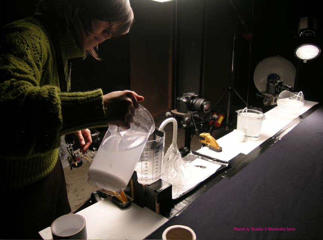
Planet A, Studio © Momoko Seto