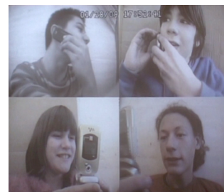
I mobile / CHAAK